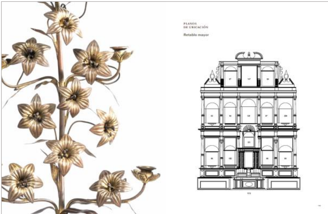
Gráficos de ubicación de las obras.